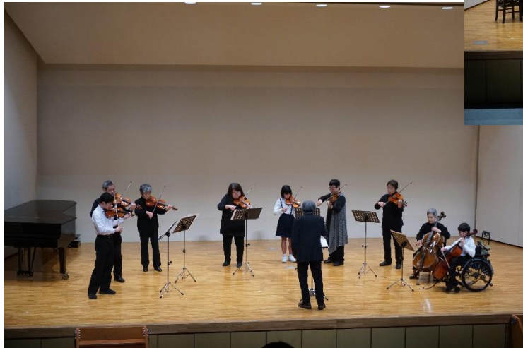
◀▲井原少年少女合唱団と井原ジュニア弦楽合奏団の皆さんは、スタインウェイピアノリレーコンサートのゲストとして舞台発表を行いました。少年少女合唱団は「秋祭り」「雪の祭り」を、ジュニア弦楽合奏団は「トレパック」「合奏協奏曲 Op.3-8」を披露しました。