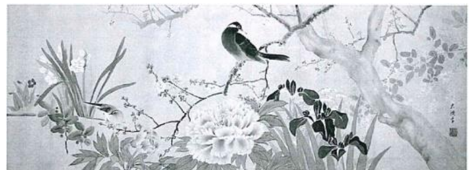
「花鳥図」制作年不詳 個人蔵